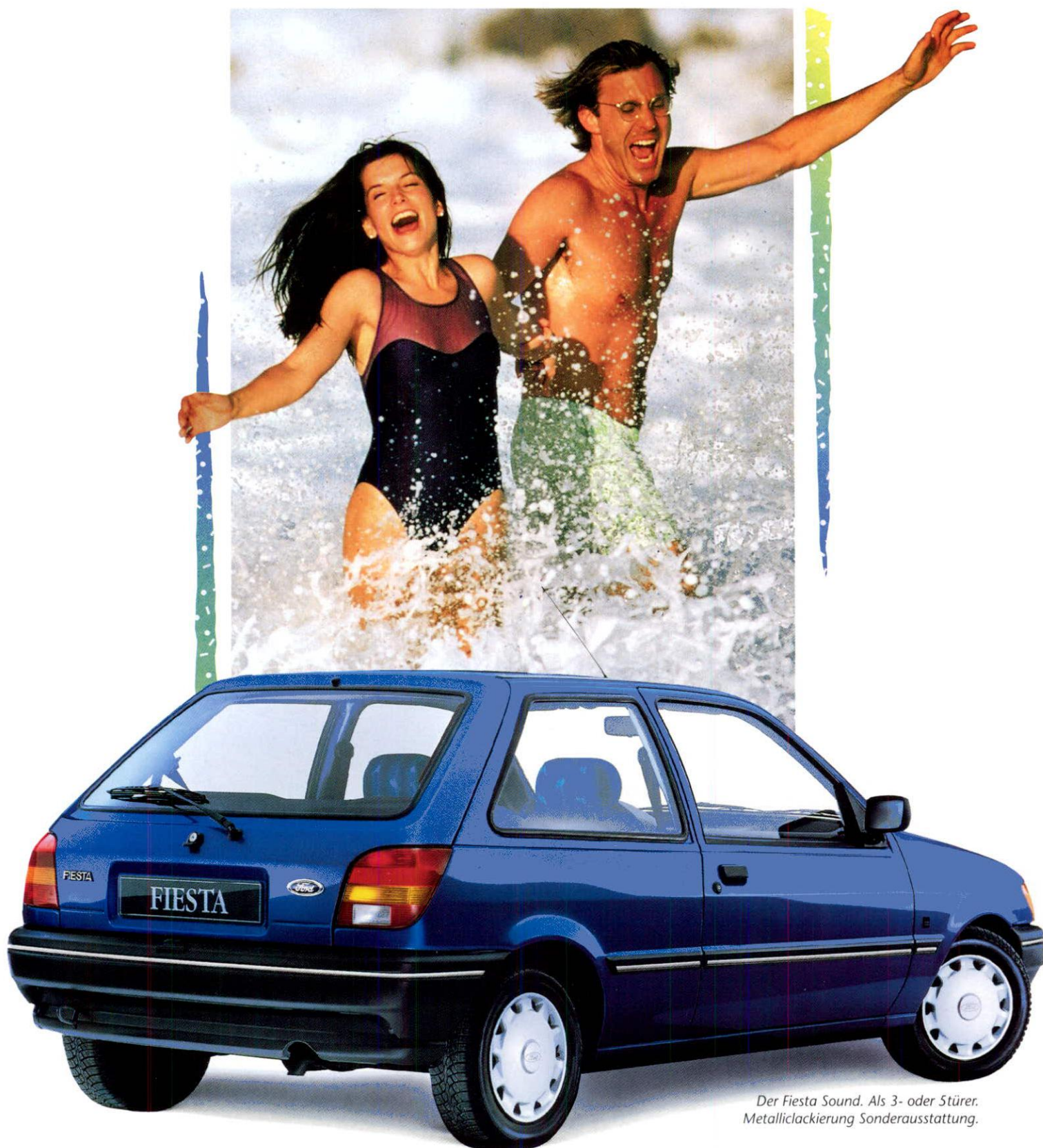
Der Fiesta Sound. Als 3- oder 5-türer. Metalliclackierung Sonderausstattung.

Jetzt gibt's einen ganz besonderen Fiesta: den Fiesta Sound. Für alle, die 's frech und witzig mögen. Mit 'ner Extraportion Spaß – zum extraguten Preis.