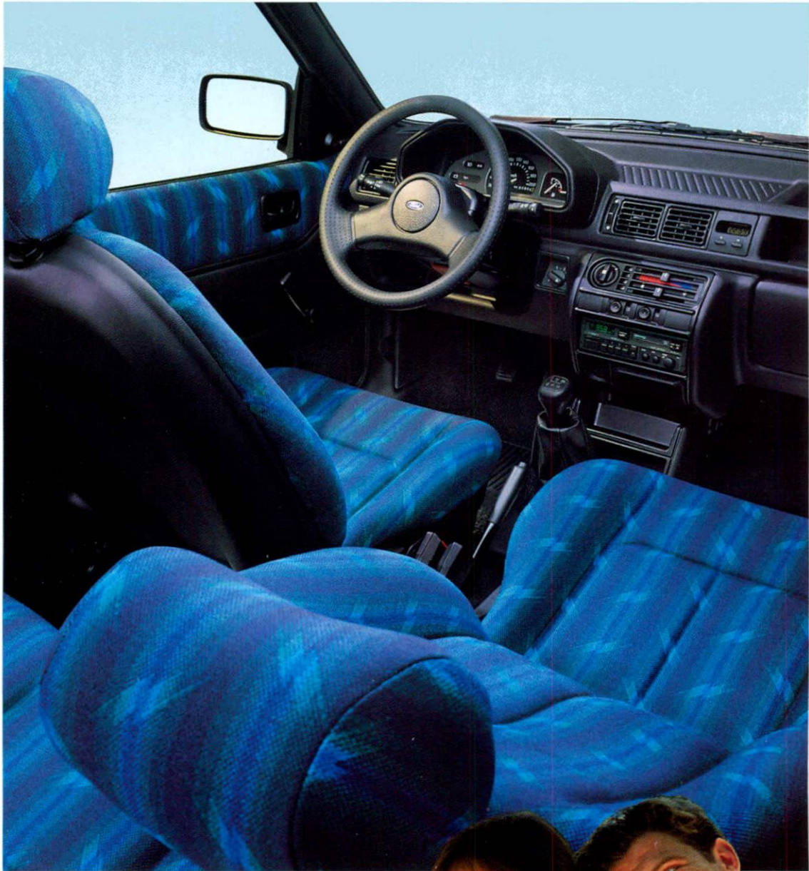
Nichts für graue Mäuse: der Innenraum des Fiesta Sound.

Tür auf – die Stimmung steigt. Der witzige Sitzbezugstoff ist nichts für graue Mäuse, paßt aber prima zum jugendlichen Fiesta-Fan.