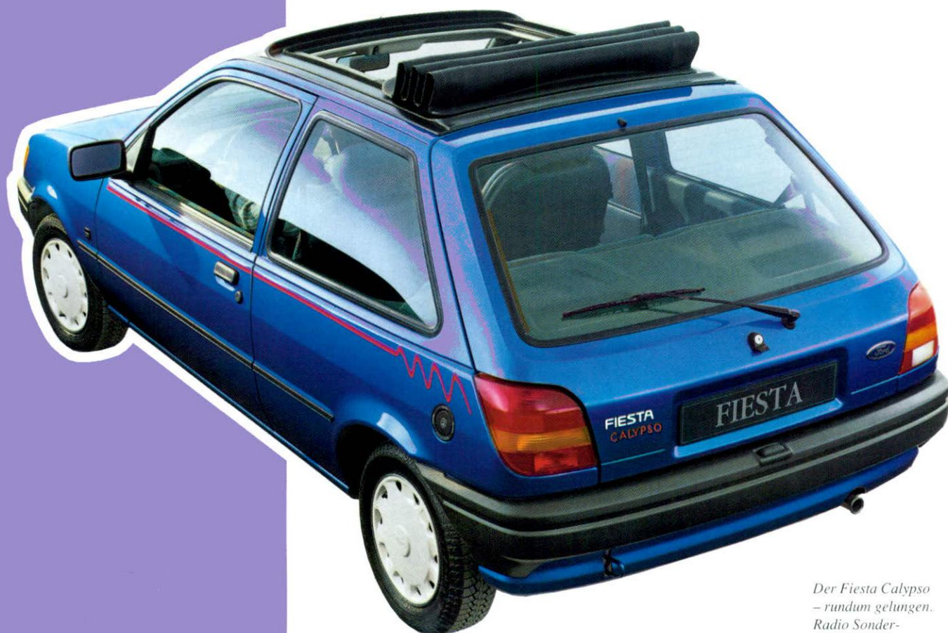
Der Fiesta Calypso – rundum gelungen. Radio Sonder- ausstattung.