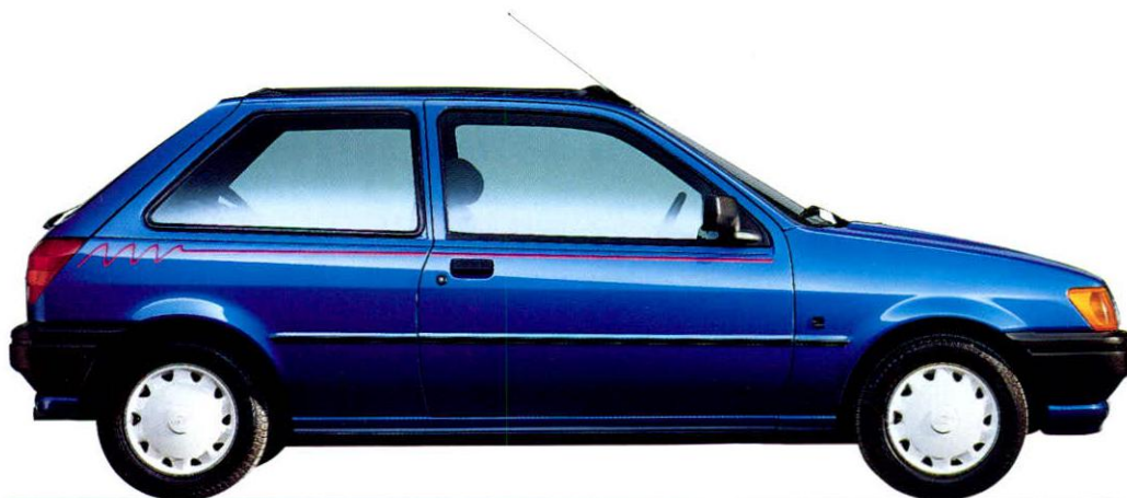
Sportlich schick – der Fiesta Calypso. Radio Sonderausstattung.

• Große Inspektionsintervalle: Nur einmal jährlich bzw. alle 20 000 km. Dazwischen ist lediglich eine Sicherheitskontrolle erforderlich.